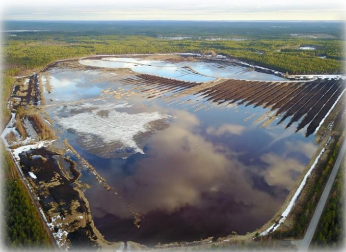
Kuva 3: Linnunsuo.